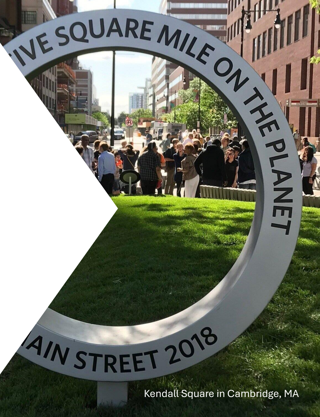
Kendall Square in Cambridge, MA